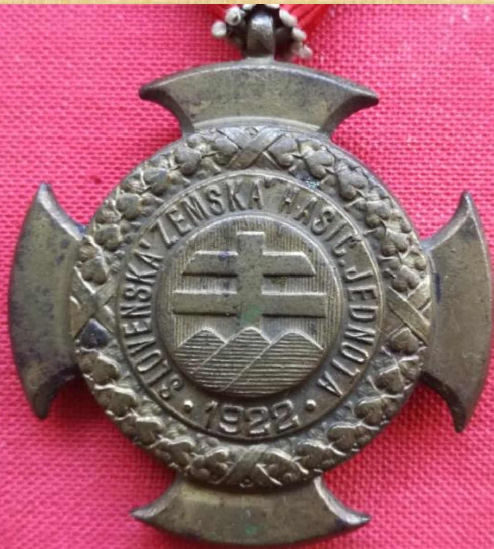
↑ Strieborný záslužný kríž: averz, reverz Silver cross of merit