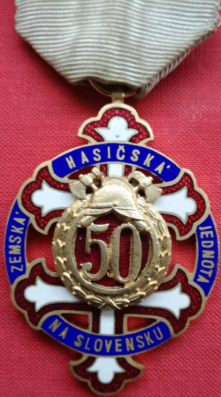
Kříž za 50 rokov služby, reverz je hladký → Cross for 50 years service, reverse of cross is clear.