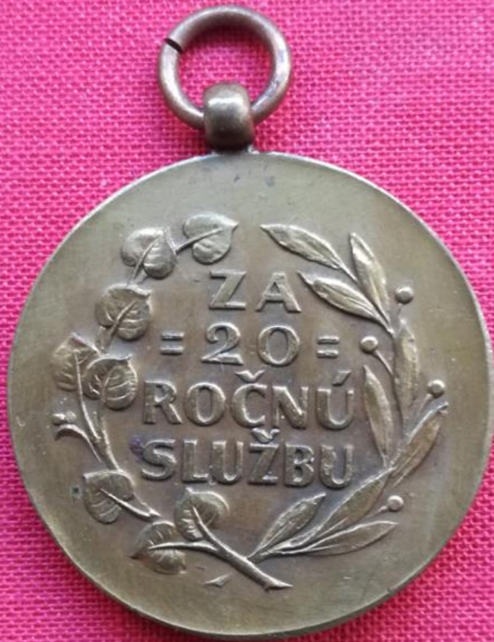
↑ Medaila za 20 rokov služby: averz, reverz Medal for 20 years service: averse, reverse