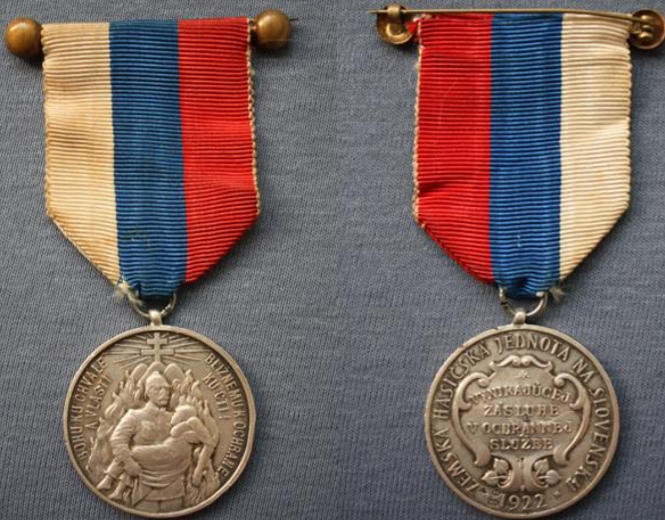
↓ Detail značenia medaile a punc Detail of marking