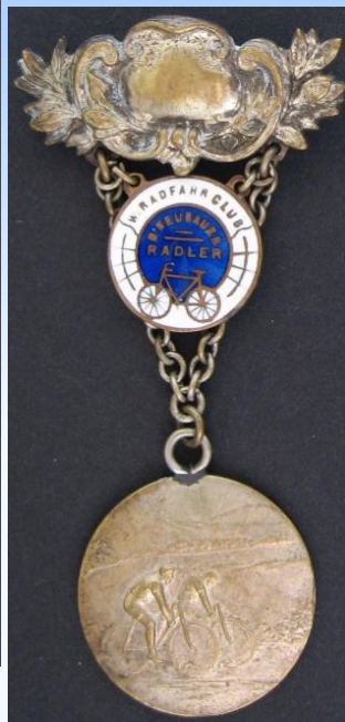
B NEUBAEUR RADLER