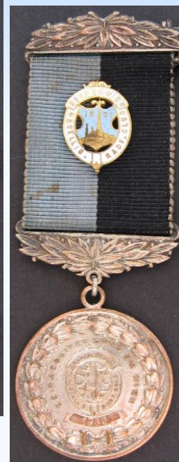
RUND UM WIEN 1891