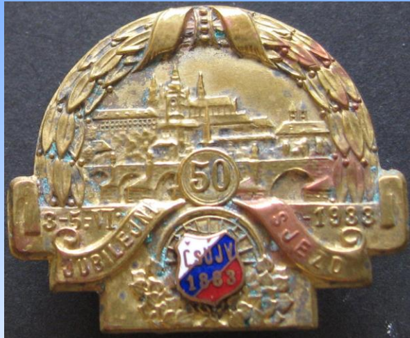
50 JUBILEJNÍ SJEZD 1933, ČSÚJV 1883

Gablonz an der Neiße 1931, 4. Preis / Jablonec nad Nisou 1931, 4. cena / 4. award